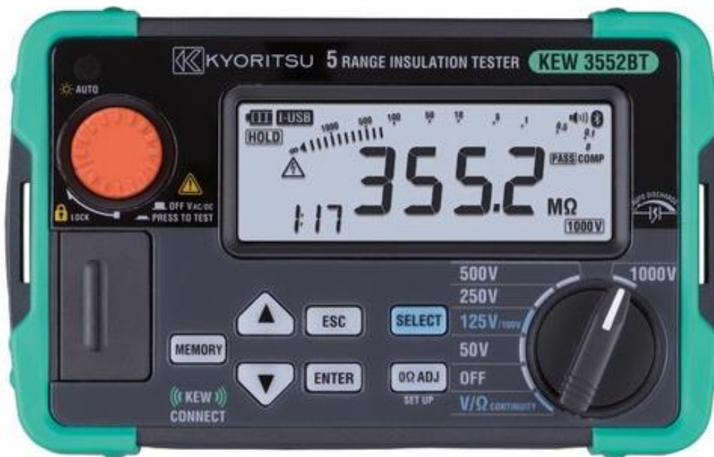
Рисунок 22 – Общий вид мегаомметров KEW 3552BT