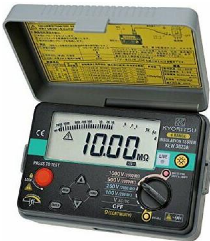
Рисунок 5 – Общий вид мегаомметров KEW 3023A