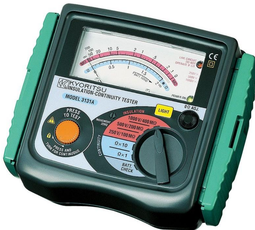
Рисунок 14 – Общий вид мегаомметров KEW 3131A