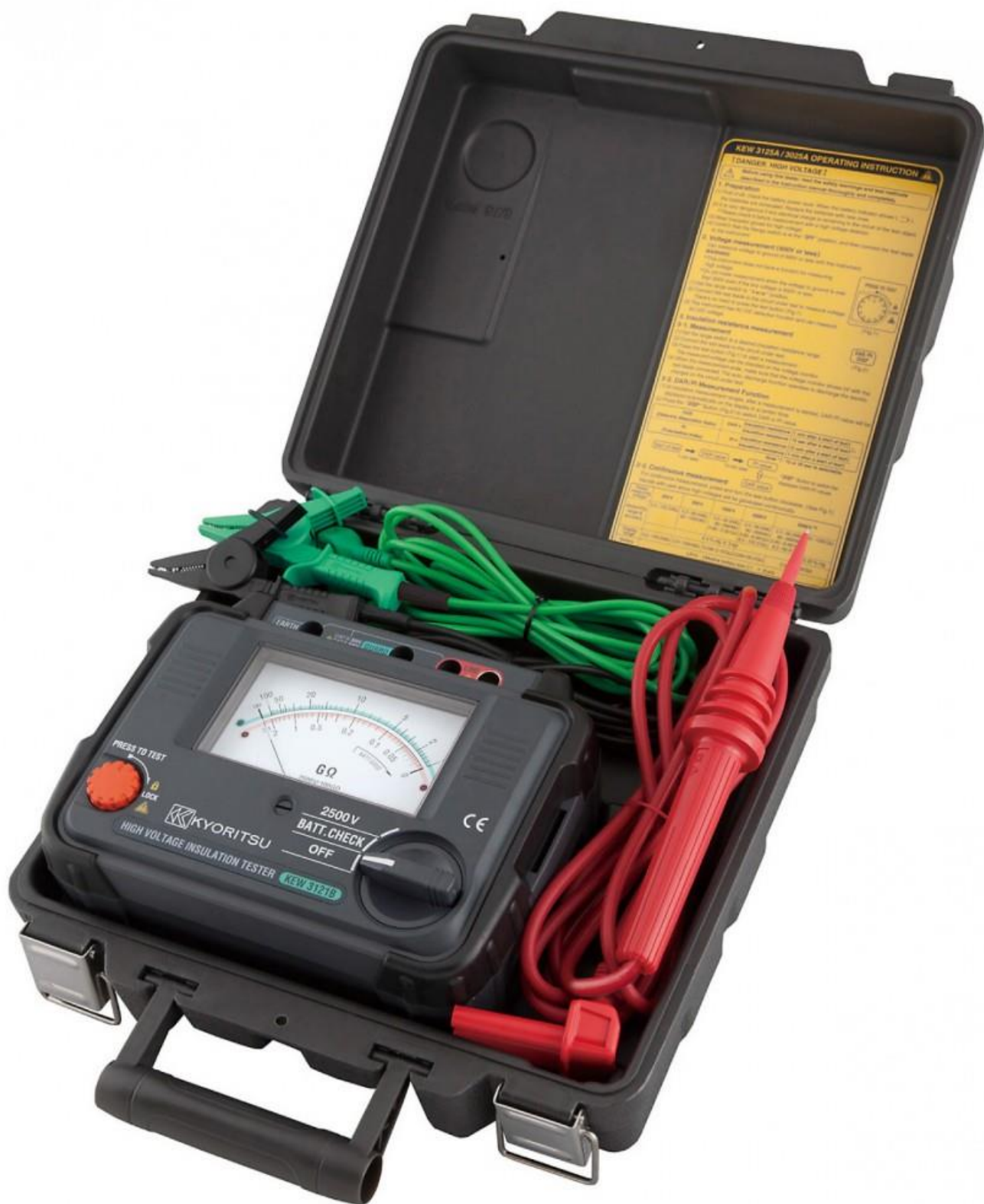
Рисунок 7 – Общий вид мегаомметров KEW 3121В