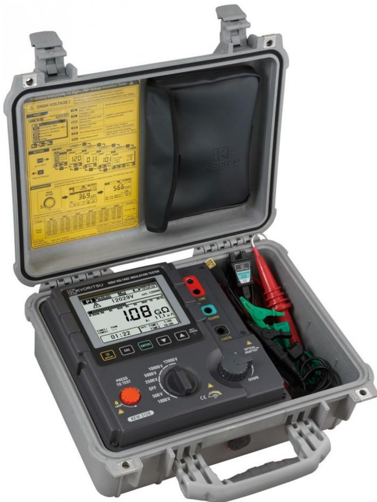
Рисунок 13 – Общий вид мегаомметров KEW 3128