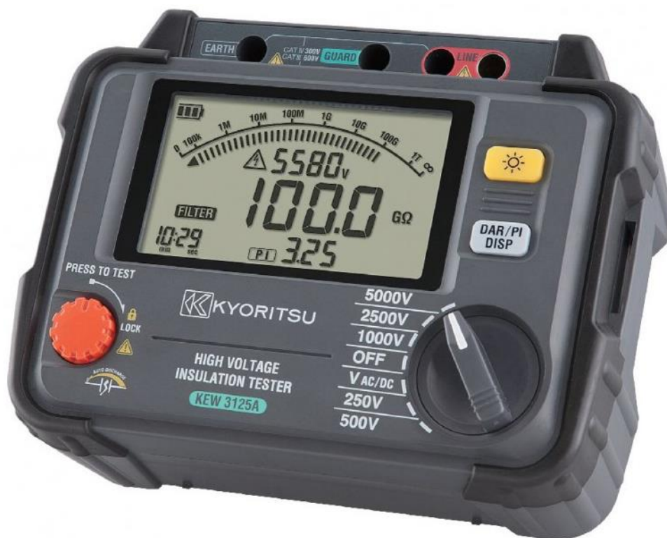
Рисунок 11 – Общий вид мегаомметров KEW 3125A