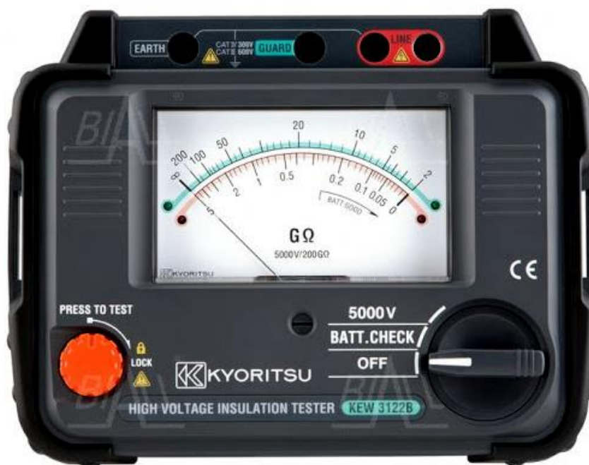
Рисунок 8 – Общий вид мегаомметров KEW 3122B