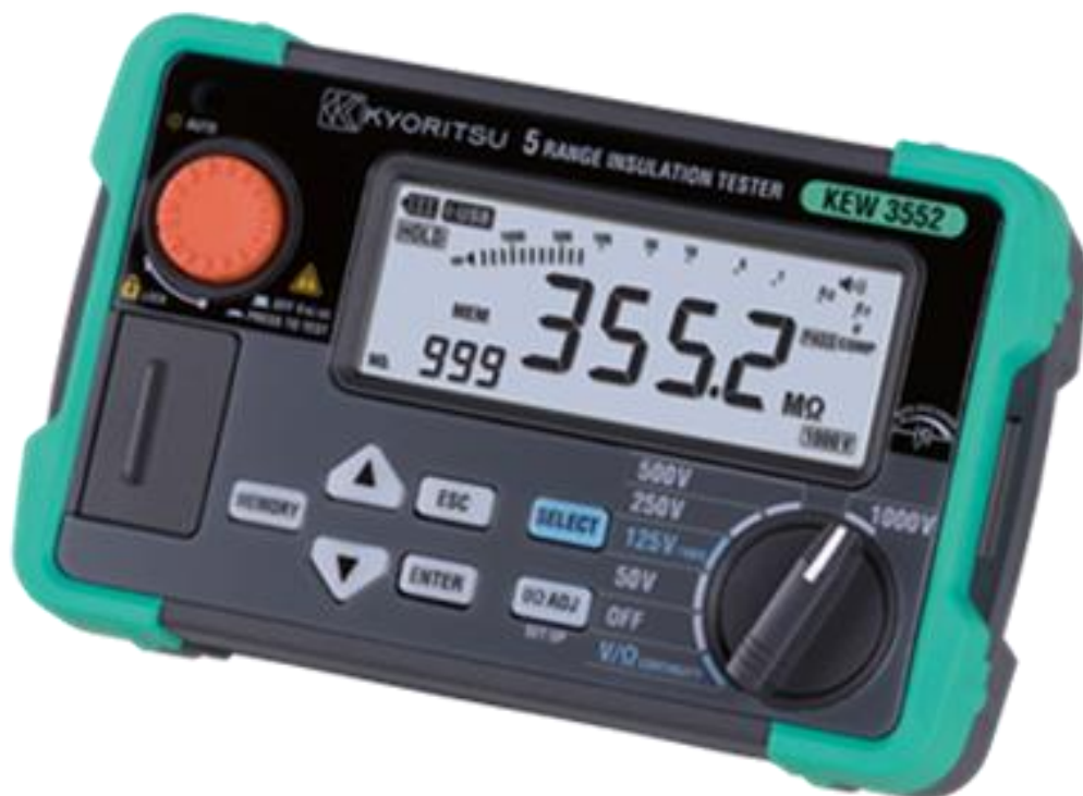
Рисунок 21 – Общий вид мегаомметров KEW 3552