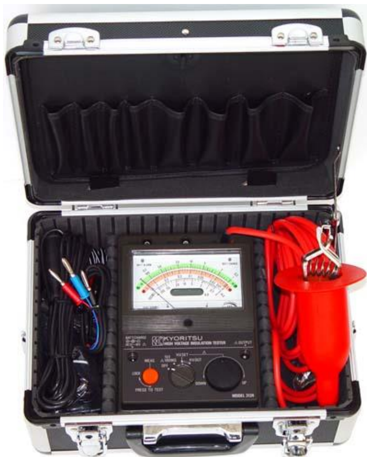
Рисунок 10 – Общий вид мегаомметров KEW 3124A