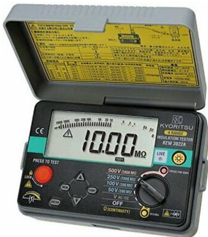
Рисунок 4 – Общий вид мегаомметров KEW 3022A