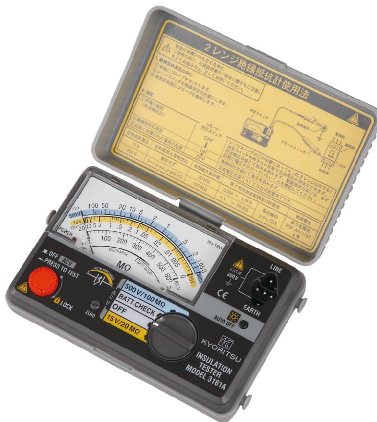
Рисунок 16 – Общий вид мегаомметров KEW 3161A