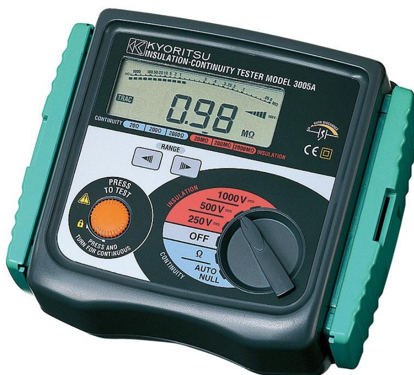
Рисунок 1 – Общий вид мегаомметров KEW 3005А

Нанесение знака поверки на мегаомметры не предусмотрено.