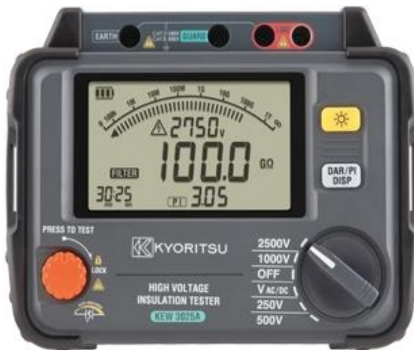
Рисунок 6 – Общий вид мегаомметров KEW 3025A