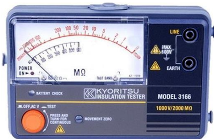
Рисунок 18 – Общий вид мегаомметров KEW 3166