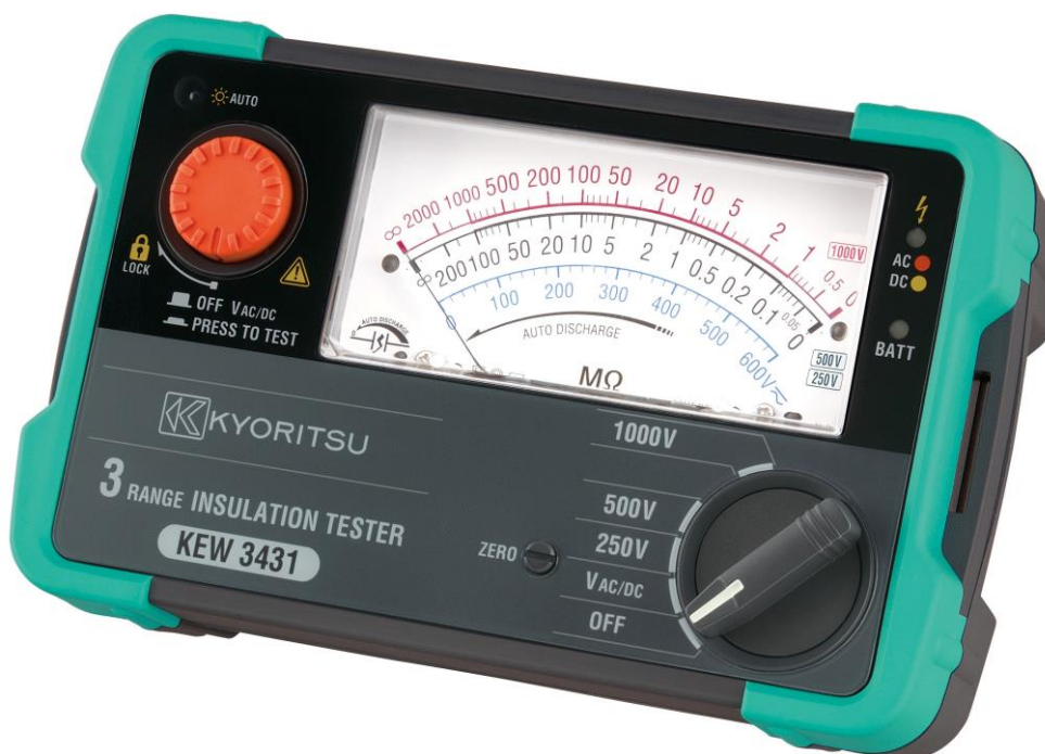
Рисунок 19 – Общий вид мегаомметров KEW 3431