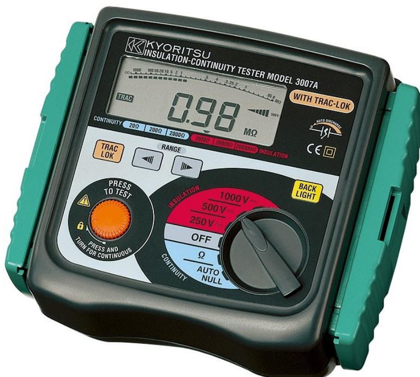
Рисунок 2 – Общий вид мегаомметров KEW 3007A