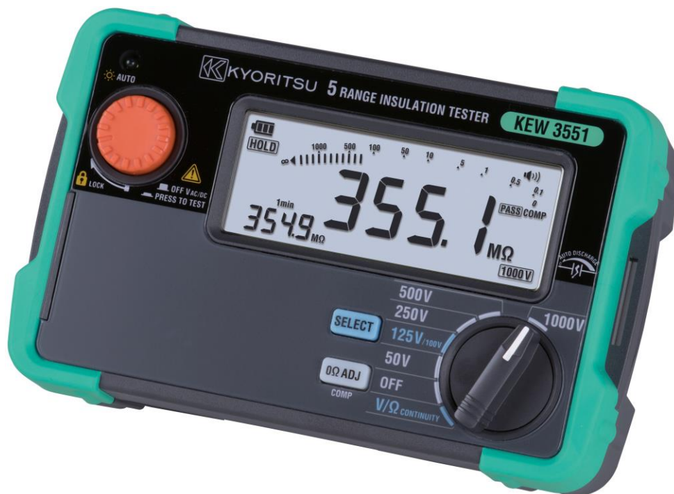
Рисунок 20 – Общий вид мегаомметров KEW 3551