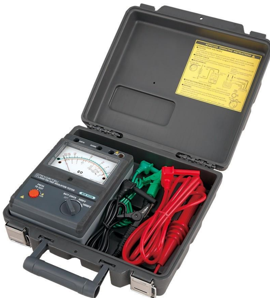
Рисунок 9 – Общий вид мегаомметров KEW 3123A