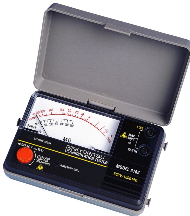
Рисунок 17 – Общий вид мегаомметров KEW 3165