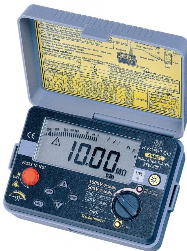
Рисунок 3 – Общий вид мегаомметров KEW 3021A