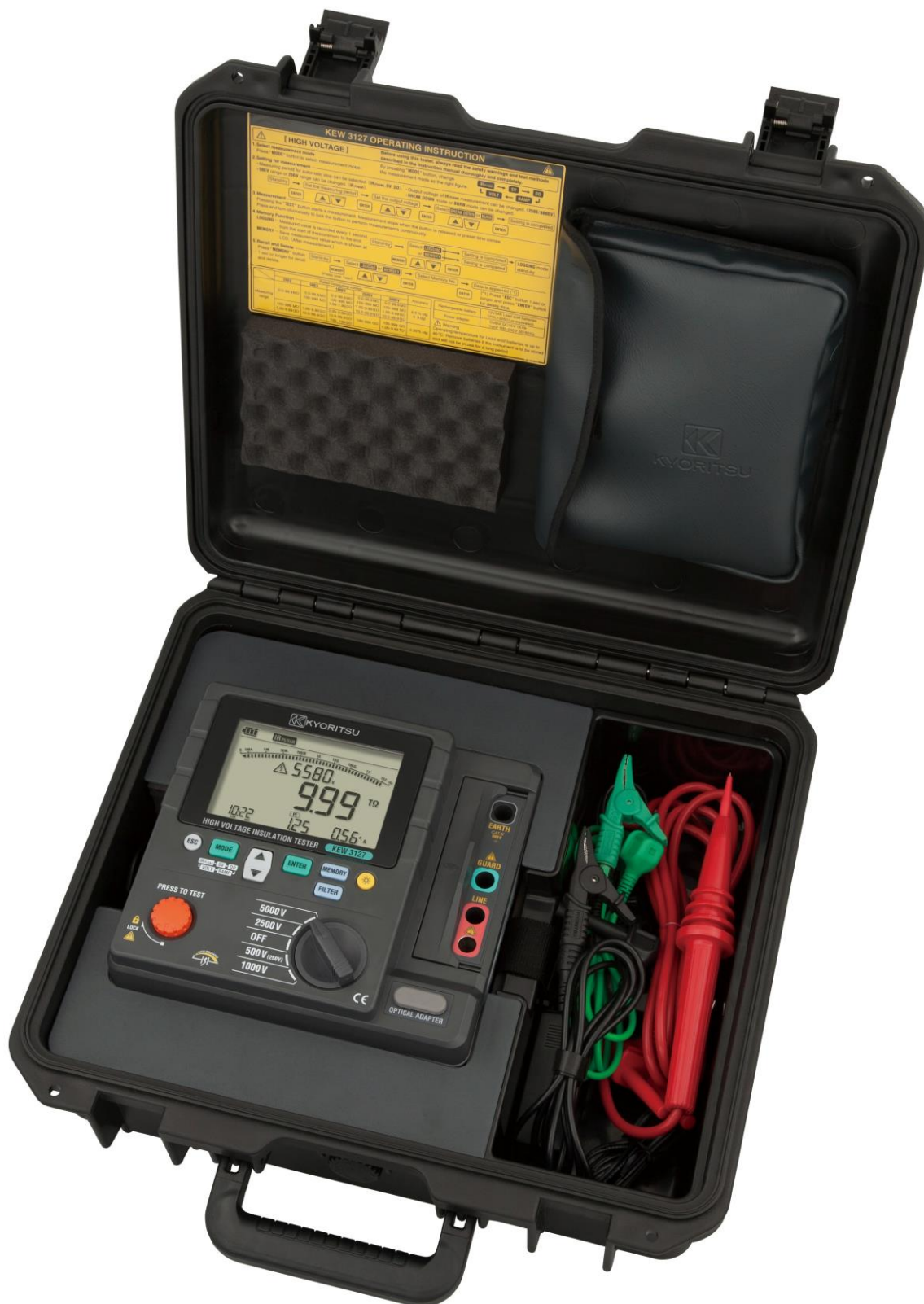
Рисунок 12 – Общий вид мегаомметров KEW 3127